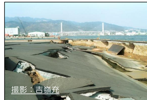
地震時の港湾構造物等の被災